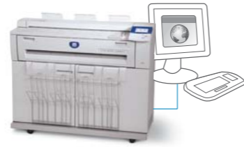
Digitaler Kopierer/Drucker mit Scan-to-File/Scan-to-Net-Funktion